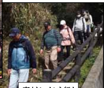
東山トレイルに行く