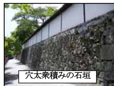
穴太衆積みの石垣