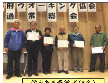
栄えある受賞者(5名)