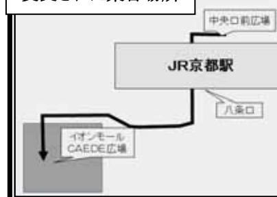
変更された集合場所