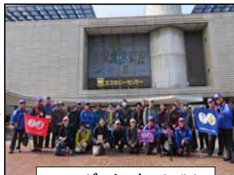
エコロジーセンター前で集合

センターでは4班に別れて、ボランティアの方の丁寧な案内で見学。地球温暖化防止の意味や、取り組むべき問題について学ぶことが出来ました。