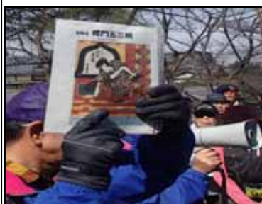
語り部が四神を語る

帰路の最後には、国内最古・最大級の伽藍で有名な東福寺を経てJR京都駅にゴールしました。